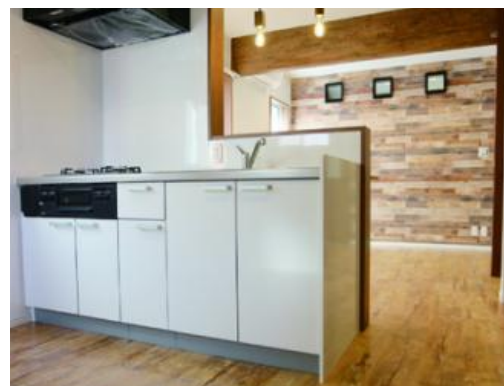
🏠 キッチン・リビング