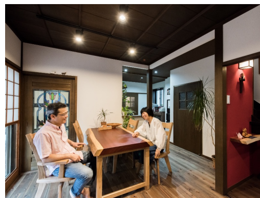
🏠 キッチン・リビング