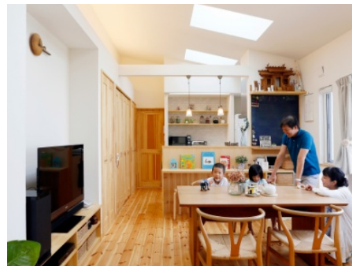
🏠 キッチン・リビング