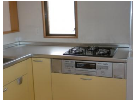
🏠 キッチン・リビング