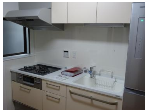
🏠 キッチン・リビング

長年住み馴れた我が家は古くなくても居心地が良いものです。施主様も一度住み馴れた家を離れ、新しい家で同居暮らしをしておりましたが、やっぱり我が家が一番、と言う結論になり戻る事に。ご用命の内容は居心地は良いけど、使い勝手が悪い、寒い、階段が急で怖い、安心、安全に暮らせる家か？を確認して欲しいとのご要望でした。ポイントは限られたスペースにキッチン、トイレ、浴室を設ける為、キッチンの位置や冷蔵庫の配置の変更をご提案し使いやすい動線を考えました。急な階段は掛け直し勾配を緩和、安心安全に暮らせるために腐食の進んだ柱や土台は出来る限り交換。今回の工事で外壁をいじらない為に交換の出来ない所は補強しました。施主様からもこれで安心して暮らせる「やっぱり住み馴れた我が家が一番」と喜んで頂けました。